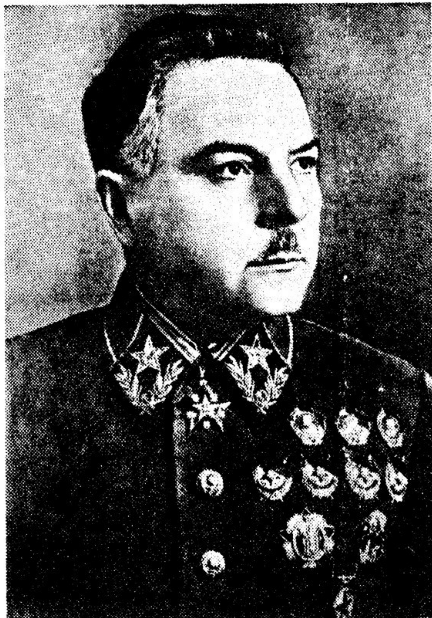
Главкомандующий войск Северо-западного направления Маршал Советского Союза тов. К. ВОРОШИЛОВ.

Мы побеждали в упорных боях со многими врагами войны. Мы победили и немецкий фашизм, на какие бы гнусные способы борьбы он ни шел. Фашистским извергам не повернуть назад колесо истории. Не видать им наших фабрик и заводов! Не сломить им гордый дух и волюскую доблесть советских людей. Сплоченный вокруг Сталина советский народ и его Красная Армия сотрут с лица земли фашистскую гадину и избавят человечество от варваров, нагло посягнувших на нашу жизнь, на нашу честь и свободу.