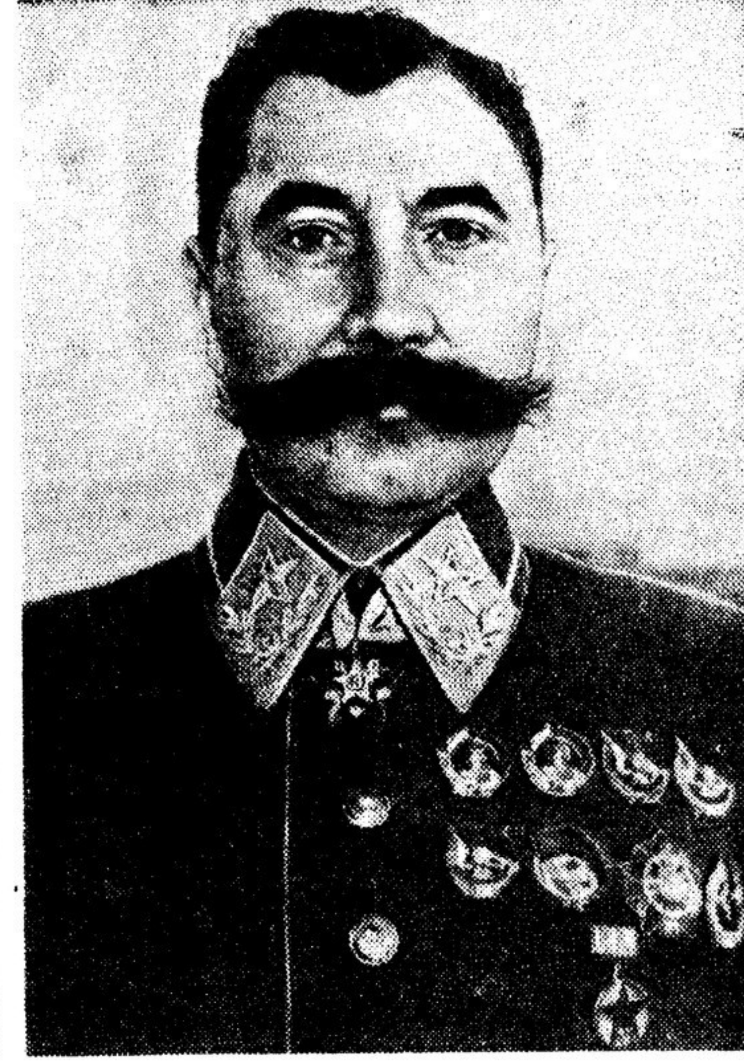
Главкомандующий войск Юго-западного направления Маршал Советского Союза тов. С. БУДЕННЫЙ.