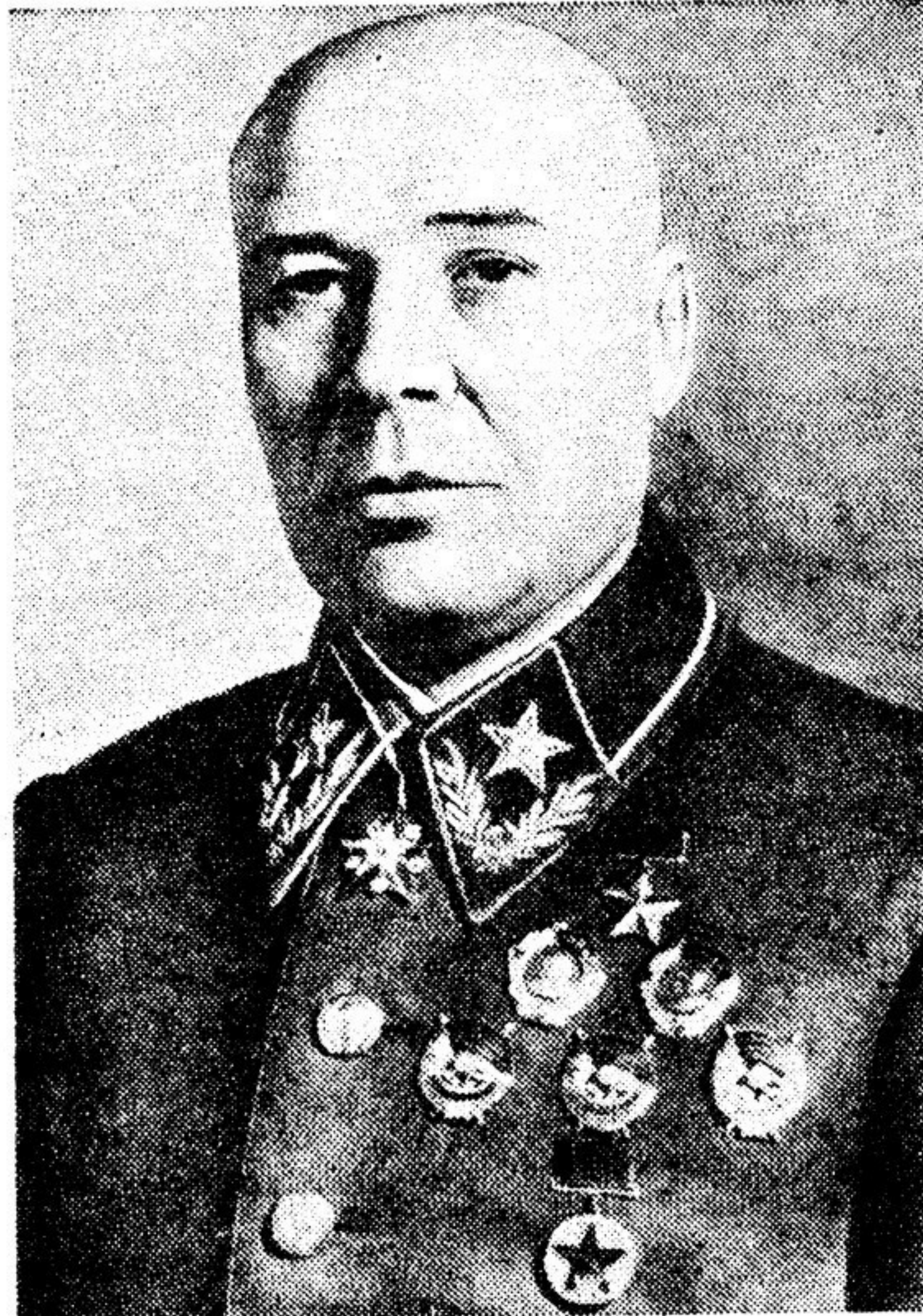
Главкомандующий войск Западного направления Маршал Советского Союза Народный Комиссар Обороны тов. С. ТИМОШЕНКО.